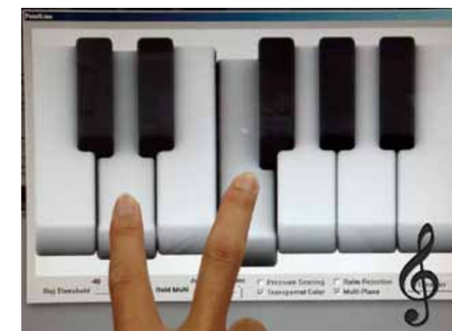
Fig.2 Multi-touch pressure sensitive virtual piano