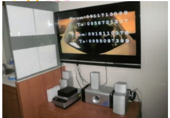
Fig.1 > 實驗應用於影音系統