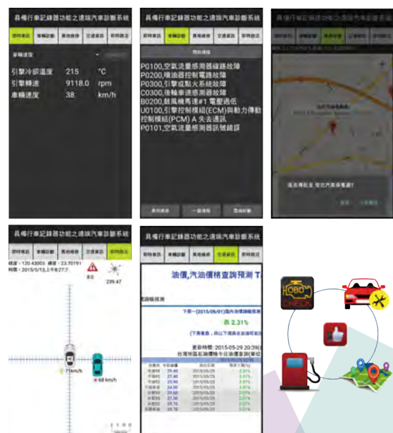
圖 2 / 作品 APP 畫面圖