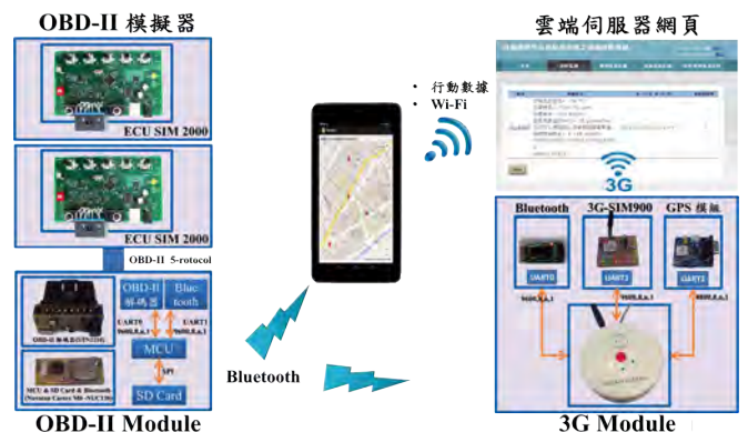
圖 1 / 中文系統架構圖