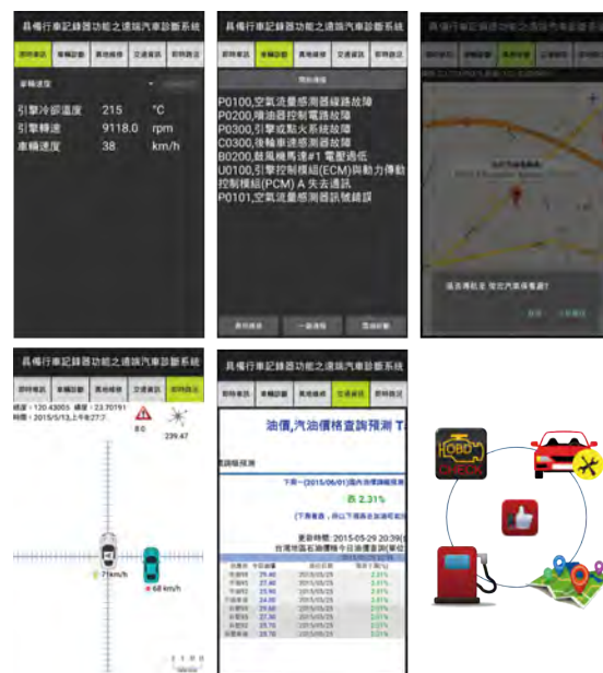
Fig.2 / Android APP