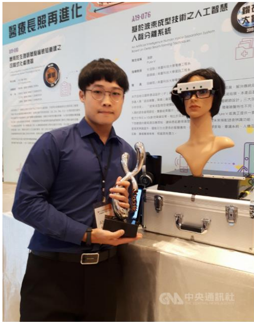
旺宏教育基金會21日舉行第19屆旺宏金矽獎頒獎典禮,南臺科技大學團隊結合人工智慧技術,改善傳統助聽器的缺點,獲得旺宏金矽獎應用組鑽石大賞,中央社記者許秩維攝 108年7月21日

設計組最大獎項鑽石大賞從缺,交通大學團隊、清華大學團隊分別以「悠遊5G智領未來:毫米波10Gbps吞吐率之單載波無限基頻傳收機晶片」、「95pJ/Label FPGA低功耗光場廣域深度處理器」作品獲得金獎。(編輯:翁翠萍) 1080721