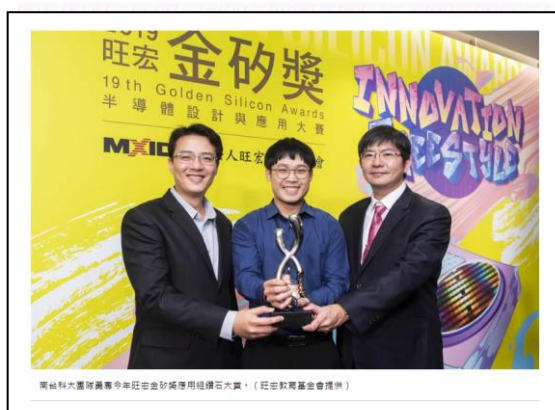
南台科大團隊獲今年旺宏金矽獎應用組鑽石大賞。

第19屆「旺宏金矽獎—半導體設計與應用大賽」今天舉行頒獎典禮，南台科大團隊以「基於波束成型技術之人工智慧人聲分離系統」作品脫穎而出，抱走應用組鑽石大賞，可得40萬元獎金；設計組金獎則分由交通大學團隊及清華大學團隊獲獎，皆可得15萬元獎金。