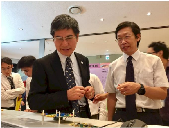
科技部長陳良基(左)21日出席金矽獎頒獎典禮，不僅領取獲獎同學的科研設計也擔任頒獎人。