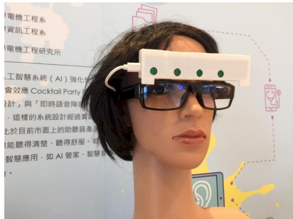
運用電腦視覺分析語音、波束成形等複雜設計，即時過濾環境背景雜音並針對每位用戶的人工智慧人聲分離系統，可以協助聽障者的對話在多人講談的場合，精準聽到自己想要的聲音。

鼓勵學生投入科研的金矽獎，今天(21日)舉行頒獎典禮，不少科研作品都契合當前的長照與醫療服務需求，成為今年相當吸睛的應用設計。到場頒獎支持的科技部部長陳良基，除了肯定已經舉辦19年的金矽獎外，也勉勵學生持續投入研究，推動世界的科研發展。