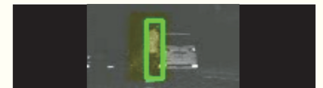
Fig. 3 Proposed pedestrian dangerous behavior detection result

This proposed intelligent lidar system, combining the self-developed solid-state LiDAR system and the pedestrian crossing prediction system, to predict the dangerous situation that may occur when driving in advance, in order to achieve the prevention of accidents and improve driving safety. The proposed pedestrian crossing behavior prediction on solid-state lidar is relatively rare in the literature as well as in industry products, which can be considered to be a relatively innovative idea and owns potential possibility to be commercialized.