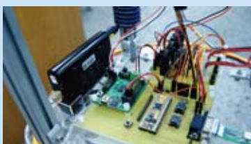
主控板、電源版、攝影機擷取盒

首先在跟隨功能方面，透過影像辨識的技術以及紅外線距離感測器來實現跟隨主人的機制，不論主人是一般行走速度、快步走、很慢甚至是突然停止，機器人都能如影隨形的跟著，且在遇到障礙物時亦可自動閃避，並與主人保持一定距離。在搭乘電梯功能方面，透過機械手臂與其上所架設之微型針孔攝影機，可實現機器人自動搭乘電梯的機制，由主人透過人機介面給予機器人目標樓層命令，到達指定樓層出電梯後便繼續跟隨在該樓層的主人。如此一來，即可使機器人能夠穿梭於各個地方，不受樓層空間限制其行動範圍，並可運用在大賣場、機場、醫院等等場所，最終達到攜物、跟隨、自動搭電梯等各種替人服務的目的。