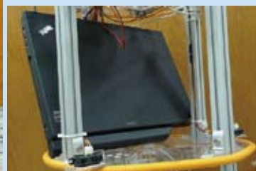
小型筆電與紅外線感測器