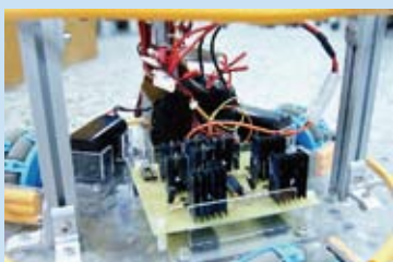
馬達驅動板與電池包