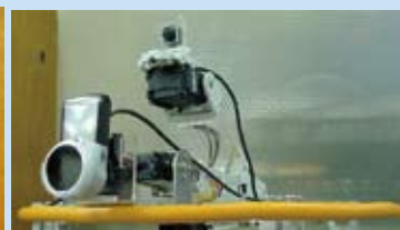
機械手臂與攝影機