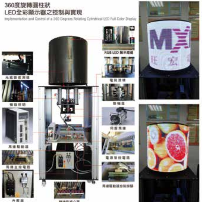
圖1 > 圓柱狀LED全彩顯示器之實體圖